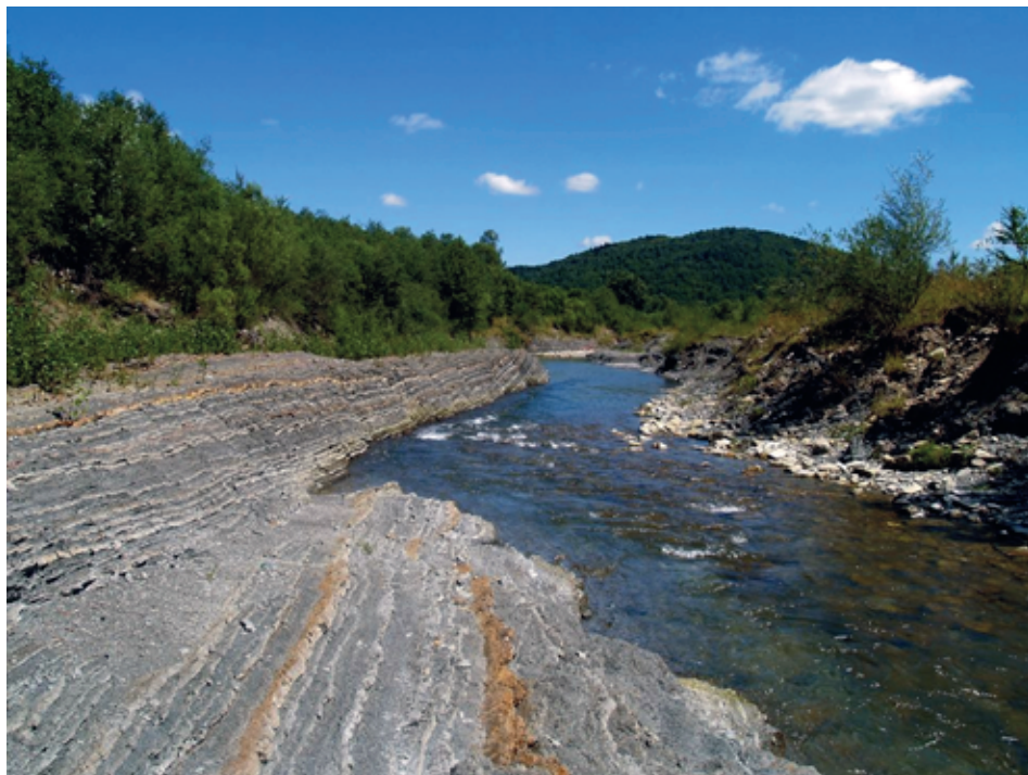
Fot. 5. Gorące Skąły – wychodnie utworów warstw hieroglifowych