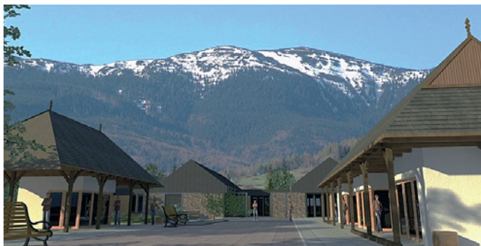
Fot. 2. Wizualizacja Centrum Górskiego Korona Ziemi

Prócz istniejącej już infrastruktury edukacji przyrodniczej, skoncentrowanej w głównej mierze na obszarze Babiogórskiego Parku Narodowego, w Zawoi tworzona jest także innowacyjna infrastruktura dotycząca edukacji górskiej. W 2013 r. utworzono bowiem tu spółkę Centrum Górskie Korona Ziemi, której celem jest propagowanie wiedzy na temat gór wysokich i himalaizmu, poprzez rekreację i rozrywkę. Centrum Górskie Korona Ziemi, którego budowa rozpoczęła się w 2013 r., ma zostać ukończona w połowie 2014 r., a w jego ramach mają zostać połączone: tradycja i kultura z nauką i technologią, poprzez rekreację i rozrywkę. Jego celem jest przedstawianie zagadnień z dziedziny geografii, geologii oraz etnografii z najwyższych gór poszczególnych części świata. Ponadto prezentowane będą tam najważniejsze dokonania alpinistyczne, ze szczególnym naciskiem na osiągnięcia Polaków. W skład Centrum Górskiego, budowanego w Zawoi-Morgach, czyli w części wsi, której główną funkcją użytkową jest turystyka, powstanie zespół budynków, wraz z infrastrukturą uzupełniającą (Prezentacja... 2013).