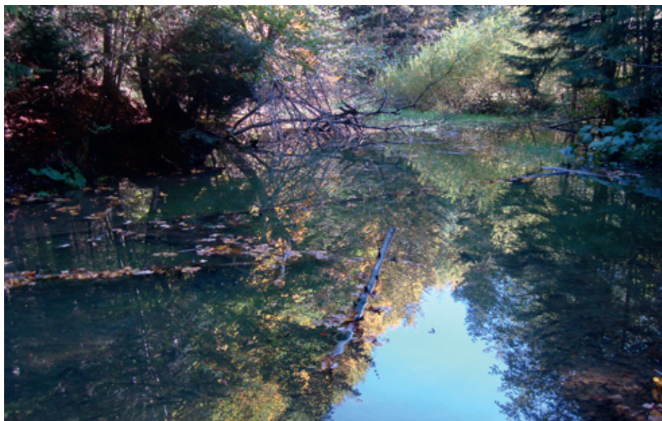
Fot. 4. Jastrzębie Jezioro – zaporowe jezioro osuwiskowe