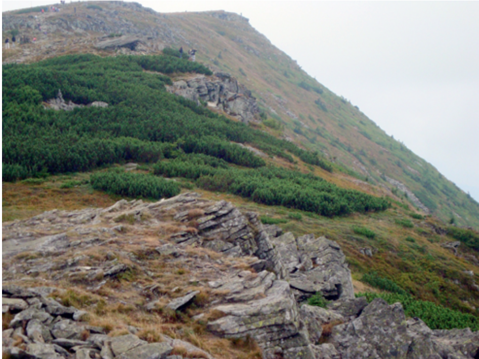
Fot. 1. Główny grzbiet Babiej Góry z kulminacją w tle

występujących tam form rzeźby terenu i różnorodność procesów geomorfologicznych możliwa jest na tym obszarze edukacja przyrodnicza w wielu aspektach nauk o Ziemi.