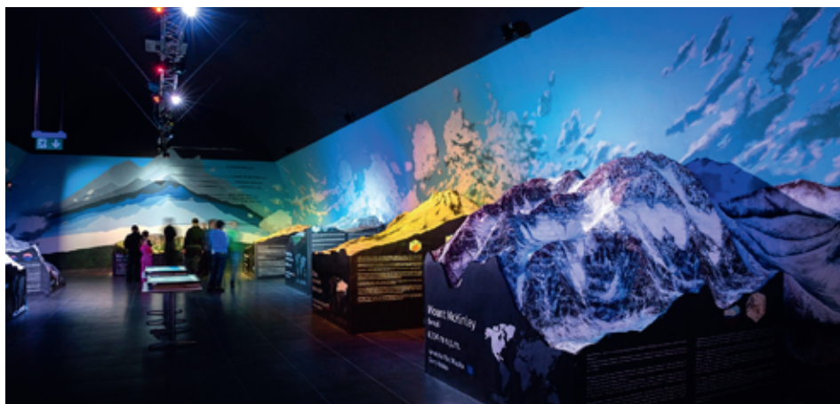
Fot. 3. Makieta w Centrum Górskim